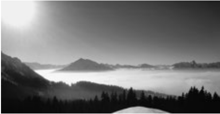
Zettenalp – Ausblick

Weiter von dort, sozusagen um die «Ecke», in der Region Schwanden-Sigriswil, herrschten ebenfalls phantastische Schneeschuhwander-Bedingungen: die Zettenalp befand sich im «Dauer-Pulverschneezustand».