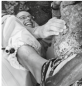
Auch Thomas kann hooken