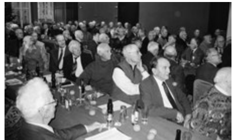
Dicht gedrängt und aufmerksam – Veteranenfeier 2009 SAC Bern