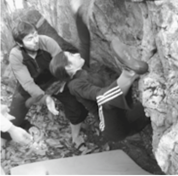
Oria am Hooken