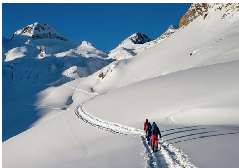
Micael Schweizer. Aufbruch Richtung Gross Läckihorn.